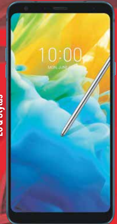
LG Q Stylus