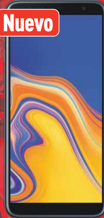
Samsung Galaxy J4+