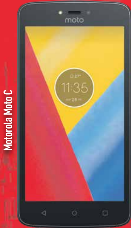
Motorola Moto C